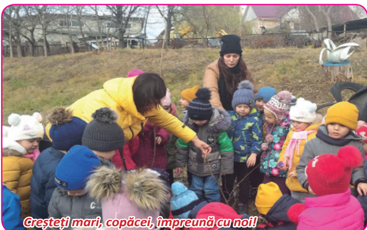
Creșteți mari, copăcei, împreună cu noi!