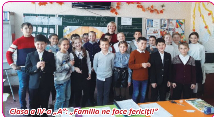
Clasa a IV-a „A”: „Familia ne face fericiți!”

Baza unei familii fericite este iubirea, respectul, toleranța, pacea și acceptarea. Deținând aceste calități, membrii unei familii pot avea o relație caldă și o casă luminoasă. Familia este cea care îți oferă sprijinul, atunci când te confrunți cu obstacolele vieții. Elevii din clasa a IV-a „A” de la Liceul Teoretic „Ion Creangă” din or. Fălești au demonstrat cât de aproape le sunt aceste adevăruri în cadrul unei lecții cu genericul „Familia este darul lui Dumnezeu pentru noi”. Au trăit emoții deosebite, s-au simțit împreună ca într-o mare familie!