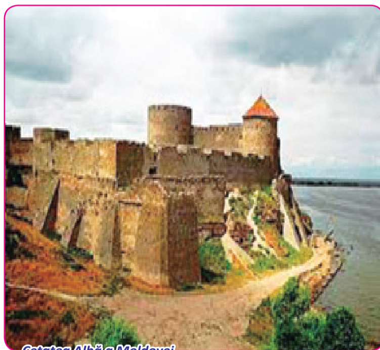
Cetatea Albă a Moldovei

Of, de-ar învia acum Ștefan-Vodă să te vadă!