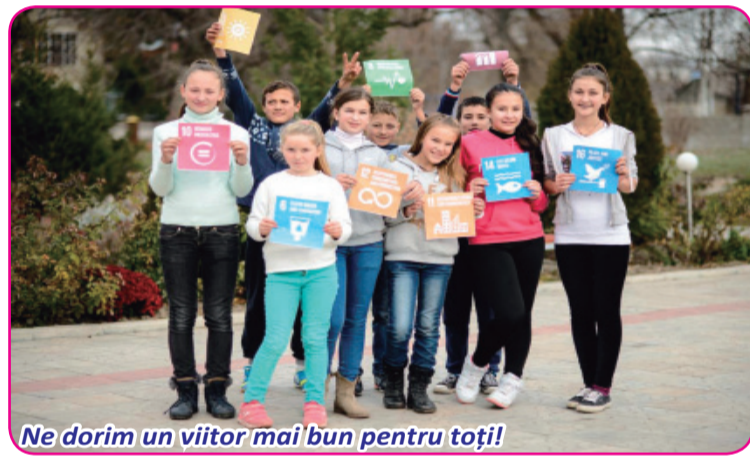
Ne dorim un viitor mai bun pentru toți!

În schimb, președintele este fața țării noastre în lume. Investițiile străine depind de reputația țării în afară. Așadar, noi locuri de muncă pot fi facilitate de președintele țării afișând un comportament care inspiră încredere.