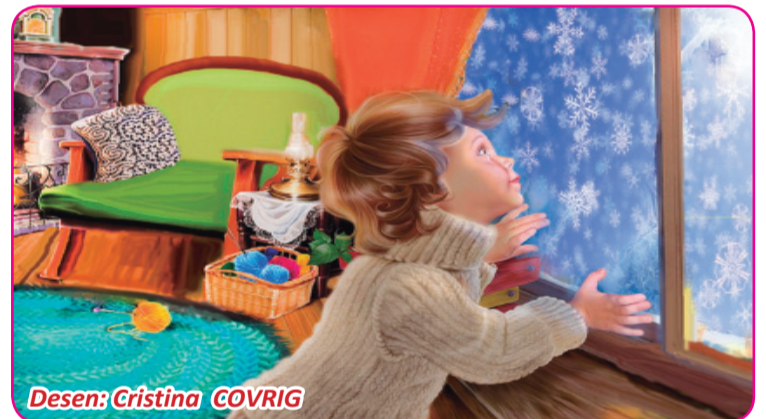
Desen: Cristina COVRIG