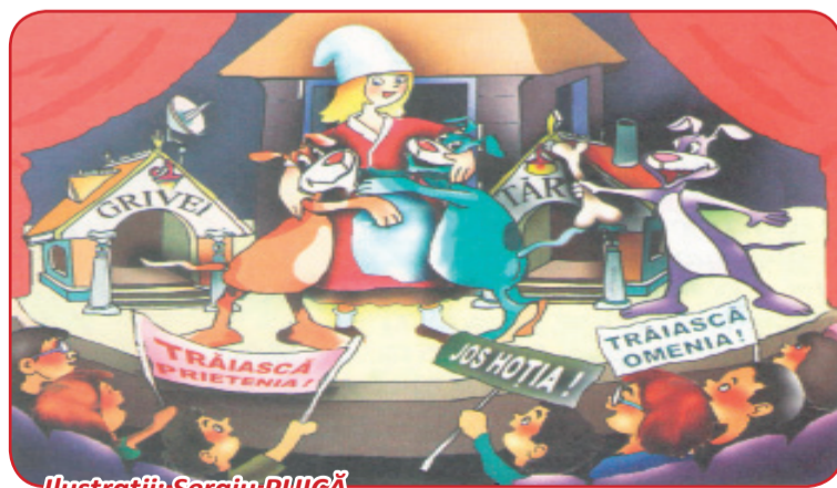
Ilustrații: Sergiu PUICĂ