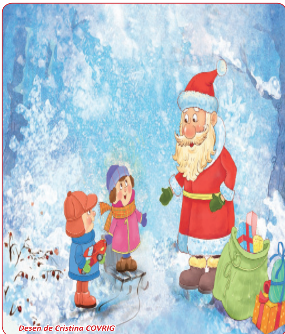
Desen de Cristina COVRIG