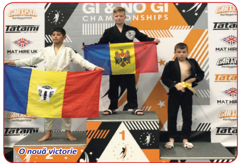
O nouă victorie