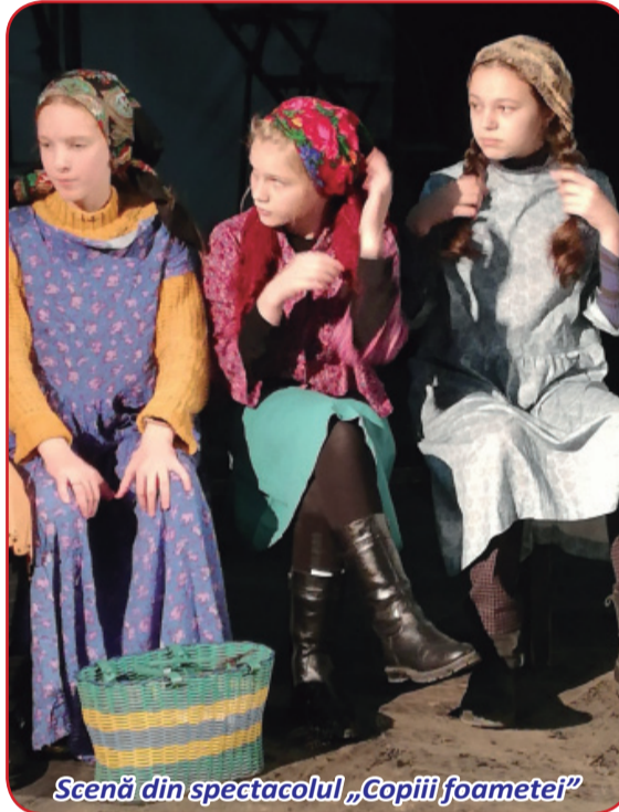
Scenă din spectacolul „Copiii foamei”

- Am câștigat locul I la Campionatul mondial, care a avut loc recent în Anglia. În general, m-am clasat pe locul I la mai multe competiții din România, Ucraina, Moldova.