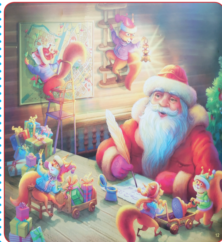
Ilustrație: Radu Diordiev

Mă întrebă un băiețandru mai zilele trecute: mata, zice,