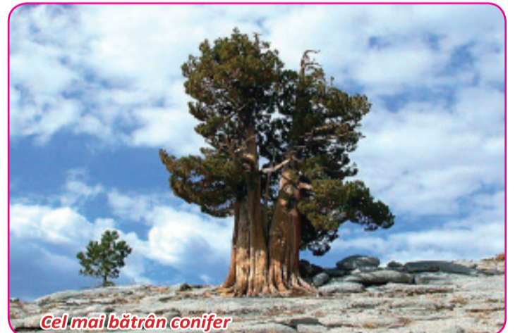
Cel mai bătrân conifer

Rudele „civile” ale bradului de Crăciun trăiesc peste tot în lume. Pot fi arbori pitici sau uriași, unii având o vârstă impunătoare. Brazilii ne plac tuturor, însă știm prea puțin despre ei. Știați, de exemplu, că acele de pin sunt aranjate potrivit numerelor Fibonacci?